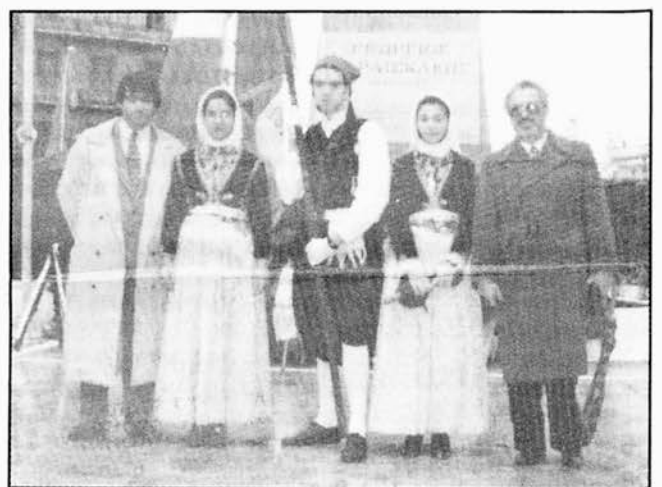
Τα νιάτα της Κυθηραϊκής Αδελφότητας Πειραιώς-Αθηνών δίνουν το επιβλητικό τους "παρών" στις εορταστικές εκδηλώσεις της 25ης Μαρτίου στον Πειραιά.