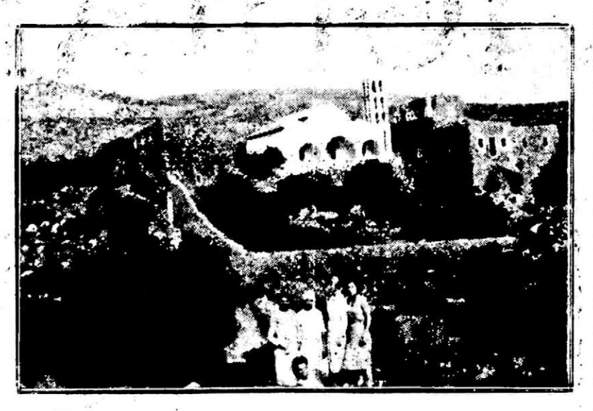
Ο ΑΓΙΟΣ ΚΟΣΜΑΣ ΣΤΟ ΞΕΡΟΥΛΑΚΙ