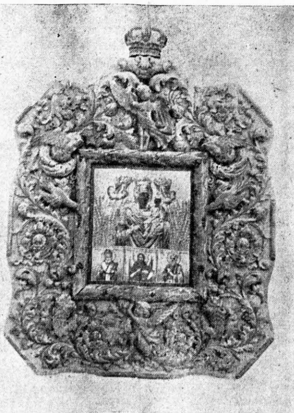
Συλλογική. - Γλυπτό πλαίσιο ἐπὶ ξύλου ἀφιερωμένο στὴν Μυρτιδιώτισσα εὐροκόμονο δεξιά τῶ εἰσερχομένου ἐκ τῆς δυτικῆς θύρας τῆς Μονῆς. - Έργον τοῦ Ἀντωνίου Τριφυλλῆ.