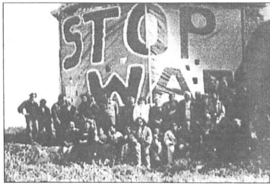
Χρόνια και χρόνια το Σημιατόρειο του Μουνάρι είχε να στείλει σημά. Νά που έγινε κι αυτό. Το μήνυμα των Κυθίων, ειρηνικό και τεράστιο, ταξίδεψε παντού, παίρνοντας το μαζί τους τα καρφία του κόσμου.

Είναι πιά γεγονός ότι ο τοπικός Κυθηραϊκός χορός διδάσκεται ευθέως από συλλόγους και σχολές Παραδοσιακών Ελληνικών Χορών. Μα κι από μουσικά συγκροτήματα το «...και στο Τσιρίγο τ' όμορφο γεννήθηκε η Ασφροδίτη» συχνά κι ανέλπιστα ακούγεται. Την Καθαρή Δευτέρα π.χ. η γιορτή του Δήμου Βύρωνας, στον Κουταλά, έζησε με το « Όμορφη Τσιριγώτισσα » και στο Θέατρο Βράχων του Υμηττού, σε παράσταση που έδωσε το Κέντρο Μελέτης Χορού Ισιδώρα Ντάνγκα , συμμετελήθημε και ο « Τσιριγώτικος ». Τώρα θα μου πείτε πώς μου φάνηκε. Μα εγώ και όλο παίρνω πως το θερμότερο χειροκρότημα ήταν πάντα για τον δικό μας χορό. Και το σπουδαιότερο. Τα κορίτσια σαν χόρευαν «Τσι-