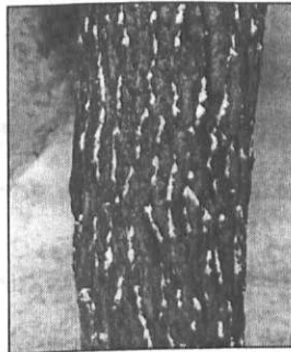
Κορμός πεύκου προσβεβλημένου από βαμβακάδα στον 7ο χρόνο της προσβολής. Καθαρίζεται κάθε χρόνο με νερό.

Το θέμα έχει απασχολήσει και άλλοτε τις στήλες μας, αλλά προσέλαβε διαστάσεις πριν ένα μήνα, καθώς μερικοί «έξυπνοι» πρότειναν την εύκολη λύση να κοπούν τα προσβληθέντα δένδρα. Είναι αλήθεια ότι ο μύκητας αυτός δεν αντιμετωπίζεται με φάρμακα κι αν αφεθεί να καταλάβει ολόκληρο τον κορμό τότε το δένδρο έχει πλέον περιορισμένη ζωή λίγων χρόνων. Άλλο τόσο αλήθεια όμως είναι ότι, αν καθαρισθεί ο κορμός με πεπασμένο νερό τότε το δένδρο δεν κινδυνεύει πλέον. Γι' αυτό και είπαμε το «Μπράβο» στην Πυροσβεστική που κλήθηκε σε μερικές περιπτώσεις κι ανέλαβε το έργο του καθαρισμού κάποιων δένδρων.