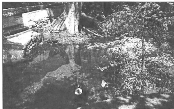
Το ονόμασαν Καμάρι και είναι πράγματι ένα καμάρι, όνομα και πράμα. Παρά ταύτα σε πλήρη εγκατάλειψη εδώ και χρόνια. Μάλλον δικαιούμαστε να ρωτάμε «γιατί».

Δεν χρειάζεται να επαναλάβουμε την προσπάθεια πολλών χωριών της Ευρώπης να σώσουν τα μορφολογικά στοιχεία των οικιστικών τους συγκροτημάτων και να τα προσβάλουν μέσα στο απαιτητικό περιβάλλον του τουριστικού αντα-