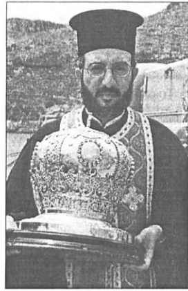
Ο Αρχιεπίσκοπος Φωτεινός Δημητρίου με το ιερό λείψανο στην προβλήτα του Καψαλίου.

ΛΟΥΔΗΣ» προσέγγισε στο Καψάλι, όπου μεταφέρθηκε με τιμητική συνοδεία κληρικών με επικεφαλής το Σεβασμιώτατο Μητροπολίτη Κυθρών η χώρα του Οσίου. Είχε προηγηθεί συνεννόηση με τις αρχές της Κορώνης και κατά την πρόσφατη επίσκεψη