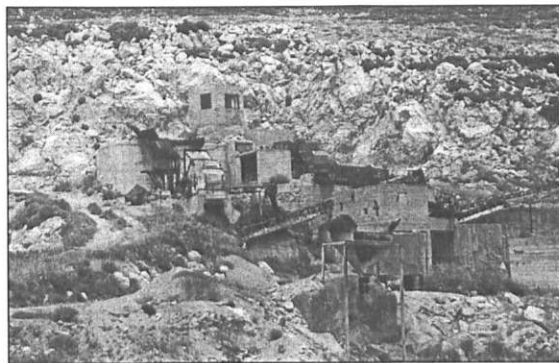
Ό,τι απέμεινε από νταμάρι στην ανατολική (θεατή) πλευρά στο Μεσηγηράκι. Τα νταμάρια αυτά έπαψαν να λειτουργούν εδώ και χρόνια, όταν το κράτος απερίσπασε να διακοπεί η λειτουργία τους, γιατί προσέβαλαν αισθητικά το τοπίο. Φυσικά, απ' ενός προβλεπόμενα η λειτουργία Λατομικών Ζωνών σε κάθε περιοχή, απ' έτερον έπρεπε οι τοπικές αρχές να επιβλέψουν για την αποκατάσταση των τοπίων εκεί που πριν λειτουργούσαν τα νταμάρια. Και η μεν Ζώνη στα Κύθηρα δημοπρατήθηκε (με τον τρόπο που γράφουμε) μόλις πρόσφατα, η δε αποκατάσταση φαινεται καθαρά στην πρόσφατη (19 Μαΐου 2001) φωτογραφία των «Κ» από το Μεσηγηράκι. Ένα αντίστοιχο λατομείο στην είσοδο της Χώρας χρησιμοποιείται για προσωρινή απόθεση σκουπιδιών. Φυσικά θα μπορούσαν να φυτευθούν λίγα δένδρα μπροστά για να μην φαίνεται το θέμα των «πληρωμένων» βουνών, αλλά ίσως δεν το σκέφτηκε κανείς ή οι αρμόδιοι ακόμα δεν ...πρόκαμαν.

τίας στα λατομεία, ιδίως στην Αττική, αλλά και στην υπόλοιπη χώρα. Για τα Κύθηρα ειδικοί του ΥΠΕΧΩΔΕ μελέτησαν και προέκριναν ως καταλληλότερο χώρο, σε σχέση με την ποιότητα του υλικού, αλλά και την προστασία του περιβάλλοντος, ένα τμήμα στη Δυτική (και αθέατη) πλευρά στο βουνό