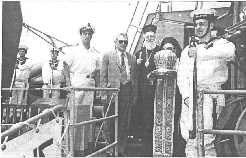
Ο Αρχιεπίσκοπος Πέτρος Κασσιμάτης με το ιερό λείψανο πάνω στην τορπιλάκατο ΚΑΒΑΛΟΥΔΗΣ, μαζί με το Μητροπολίτη Κυθρών Κύριλλο και το Δήμαρχο κ. Καλλίγερο, την ώρα, που απόσπασμα του Πολεμικού Ναυτικού αποδίδει τιμές.

ντος του Μητροπολίτου Κυθρών και τον προσκεκλημένον, Μητροπολίτη Μαντινείας Αλεξάνδρου και του Επισκόπου Θεσσαλονίκης Ιωάννη, έγιναν ο εορτασμός και η θεία Λειτουργία, παρουσία των τοπικών αρχών και πολύ κόσμου. Στους προσκεκλημένους και κάτοικους της Κορώνης με επικεφαλής το Δήμαρχο, προσεφέρθησαν γλυκά και αναψυκτικά.