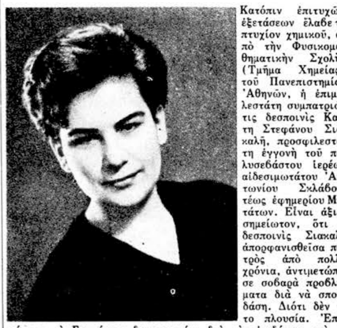
Κατὰ τὴν ἐπιτυχίαν ἐπέτασαν ἐλαβε τὸ πτυχίον χημικοῦ...