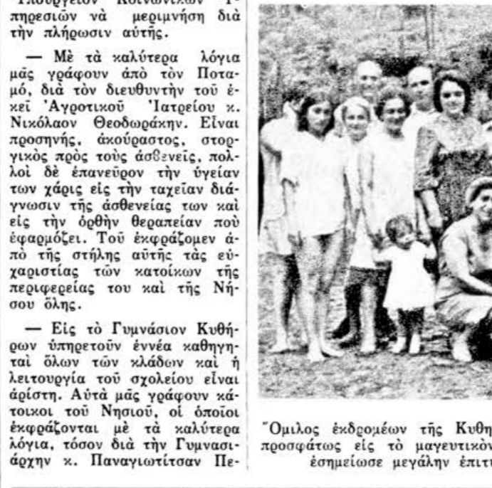
Ομιλος εκδρομίων της Κυθηραϊκής Αδελφότητος Συνδύ Αυστραλίας...